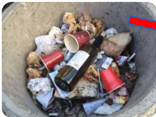
Coșul de gunoi zilnic